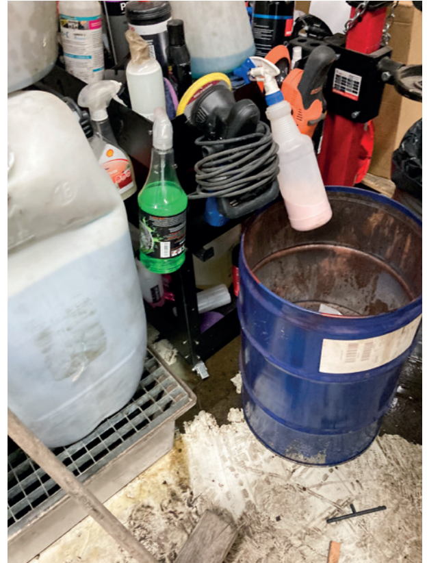
Oliespild skal samles om straks!