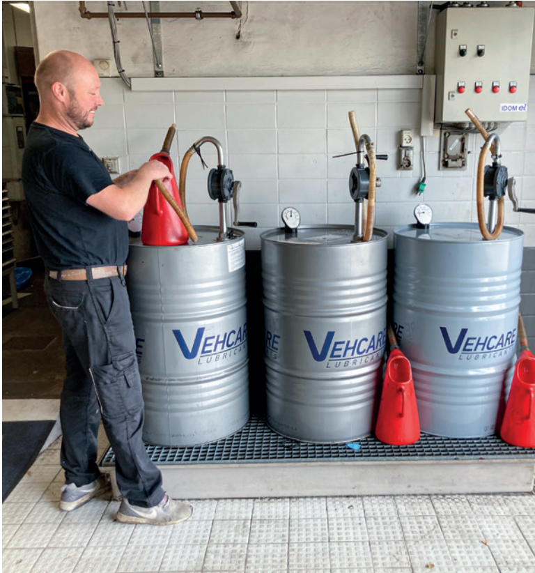
Korrekt brug af spildbakke, sikrer dig mod forurening.