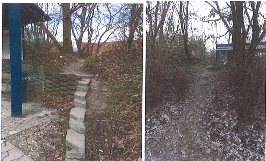
Nr 2 billede er taget fra

Flere steder har passagerne lavet deres egne adgangsveje – ofte kaldet viljens sti. Det er dog ikke alle selvbestaltede stier, der er lige tilgængelige for alle – eksempelvis ved stoppestedet Hyldespjældet Store Torv i retning imod Albertslund Station.