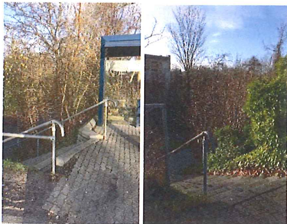
Tranehusene – begge retninger – mangler lys

Andre adgangsveje til stoppestedet bør ligeledes være belyst.