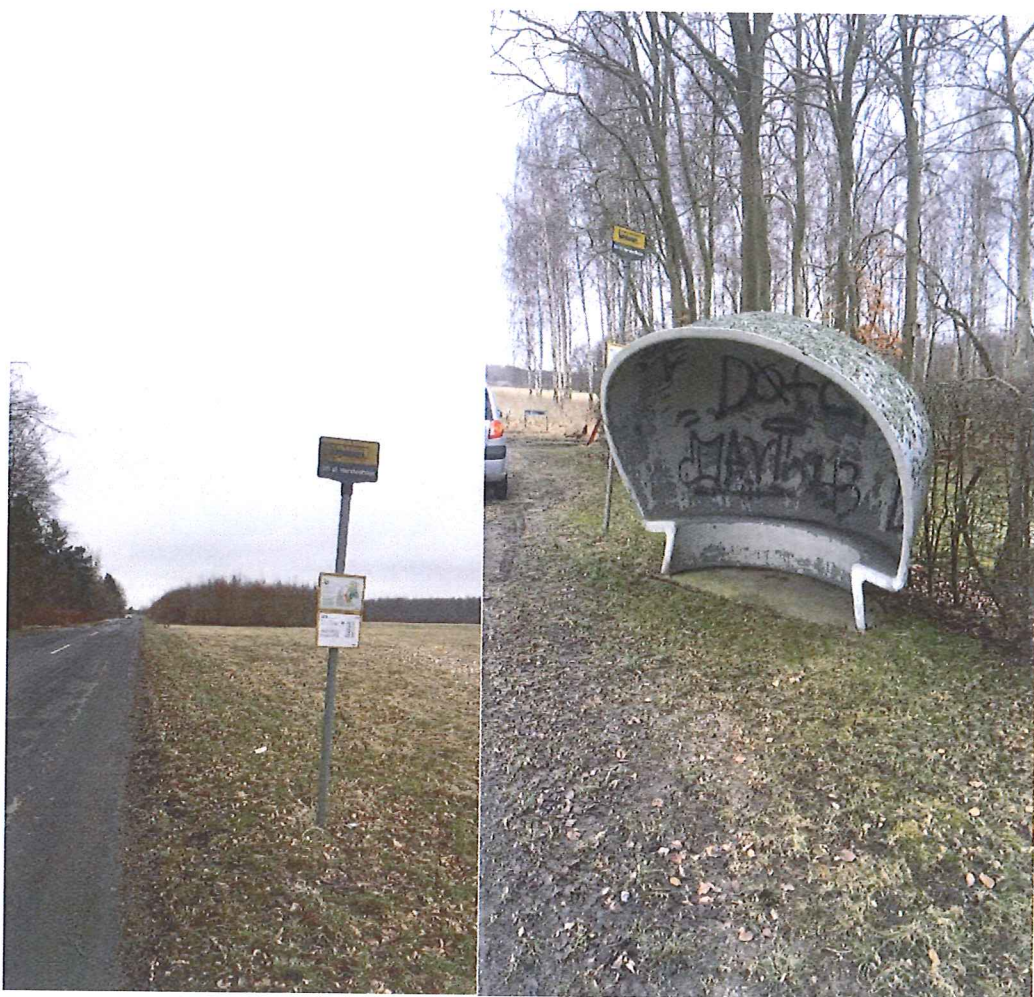
Sti til Herstedhøje – begge retninger

Bus 143 kører ad denne rute med kun i dagtimerne, hvilket er ret heldigt, da ingen af stoppestederne er belyst. Få af stoppestederne har læskærm og fortov – de fleste stoppesteder står man på vejen eller i græsribatten og venter på bussen. Om søndagen er der ingen busbetjening, så det er ikke muligt denne dag at tage bussen for at tilbringe nogle timer i skoven.