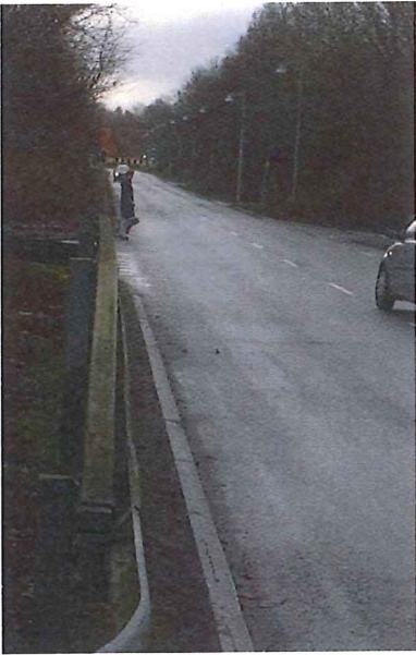
Vegavænget Dame med stok der krydser vejen

Stoppestederne Tranehusene, Falkehusene og Roholmparken er mindre trafikale knudepunkter. Der kører mellem 15-18 busser til stoppestederne i timen i dagtimerne. En del passagerer skifter bus ved et af stoppestederne i forbindelse med linje 143/144 til Ballerup. Adgangsvejene er uacceptable ikke alene for personer med rollator og barnevogn men også for andre med bevægelsesbegrænsninger eller helt almindeligt gående. Eneste adgangsveje er trapper eller en større omvej og derfor benyttes kørebanen i stor stil - også i T-krydset ved Tranehusene.