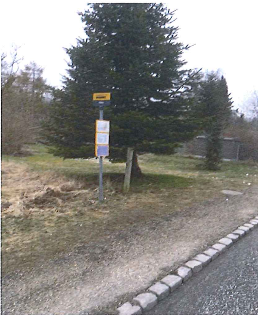
Stoppested Risby (rute 144)

Bus 144 følger en ny rute, som kører over Ledøje til Ballerup. Der er 1 stop der ligger i Albertslund Kommune – Risby. Der er dårlig belysning.